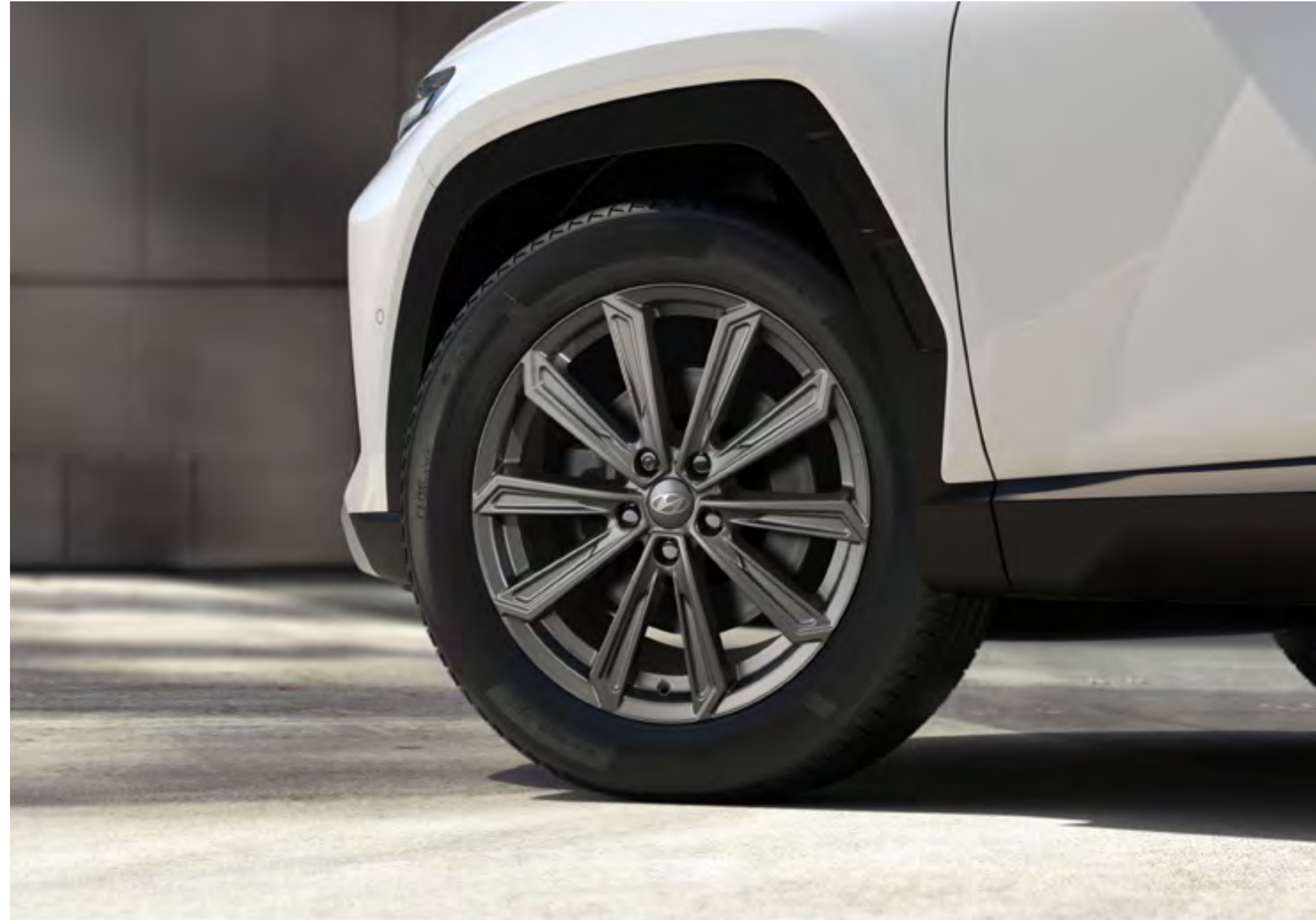
Tuercas antirrobo, cromo oscuro, 99490ADE50DC