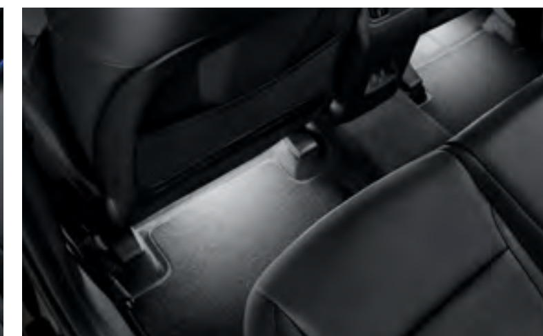
Set iluminación interior led, blanco, plazas traseras, 99650ADE31W