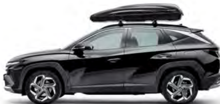
Baúl portaequipajes 390, 195 x 73.8 x 36 cm, 99730ADE00