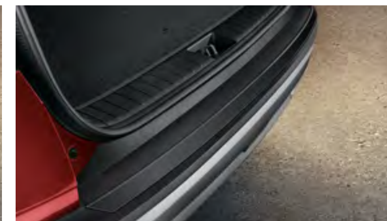
Moldura embellecedora paragolpes trasero (black grained), N7274ADE00