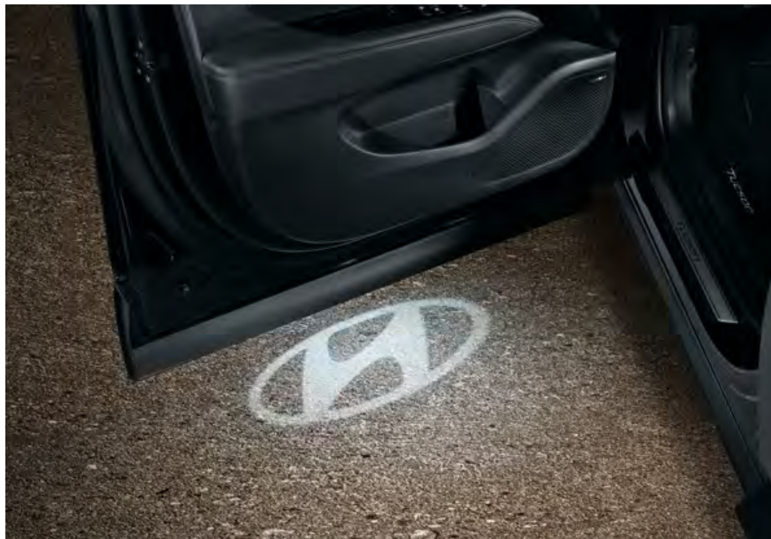
Set iluminación inferior puerta, logotipo de Hyundai 99651ADE00H

Tanto si eliges la luces brillantes o las sutiles, las blancas o las azules, crea un ambiente acogedor con una agradable luz de bienvenida cuando se abren las puertas.