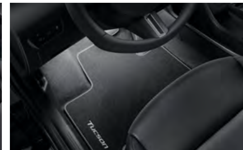
Set iluminación interior led, blanco, plazas delanteras, 99650ADE20W