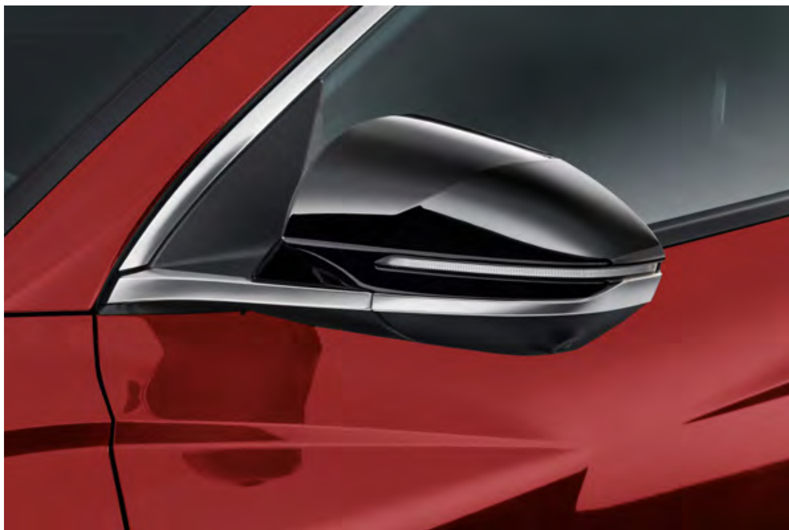
Set de cubiertas para espejos retrovisores, N7431ADE00BL