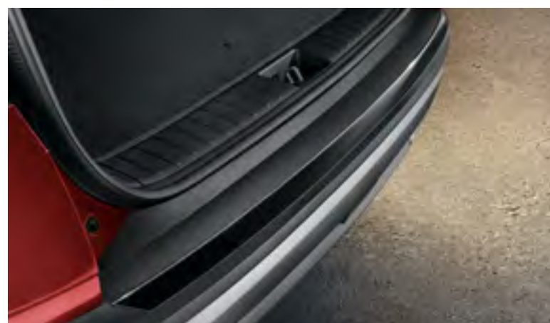
Moldura embellecedora paragolpes trasero (piano black), N7274ADE00BL