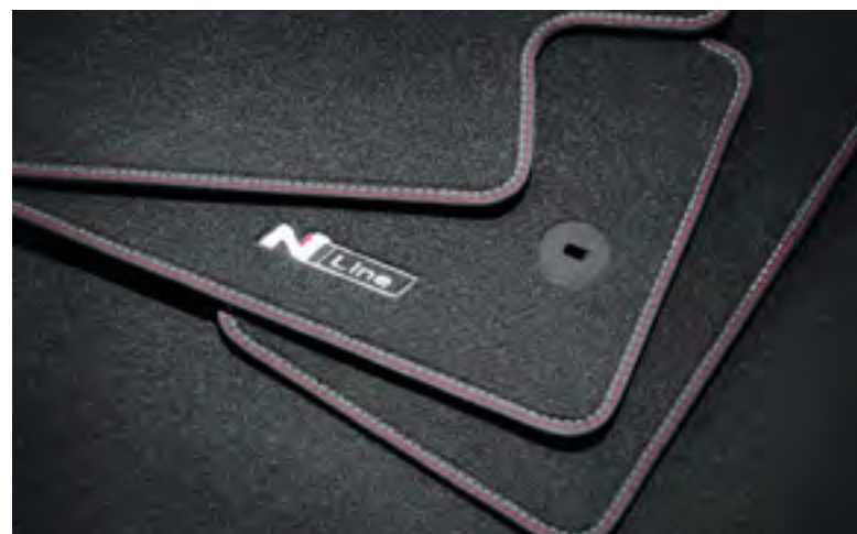
Alfombrillas textiles, velour, N7143ADE00NL, CZ143ADE00NL, CZ143ADB00PHNL