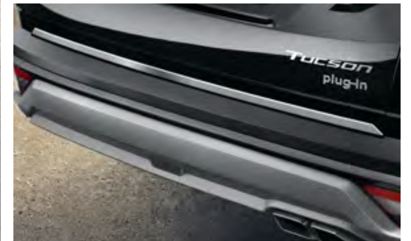
Moldura portón trasero, N7491ADE00BR