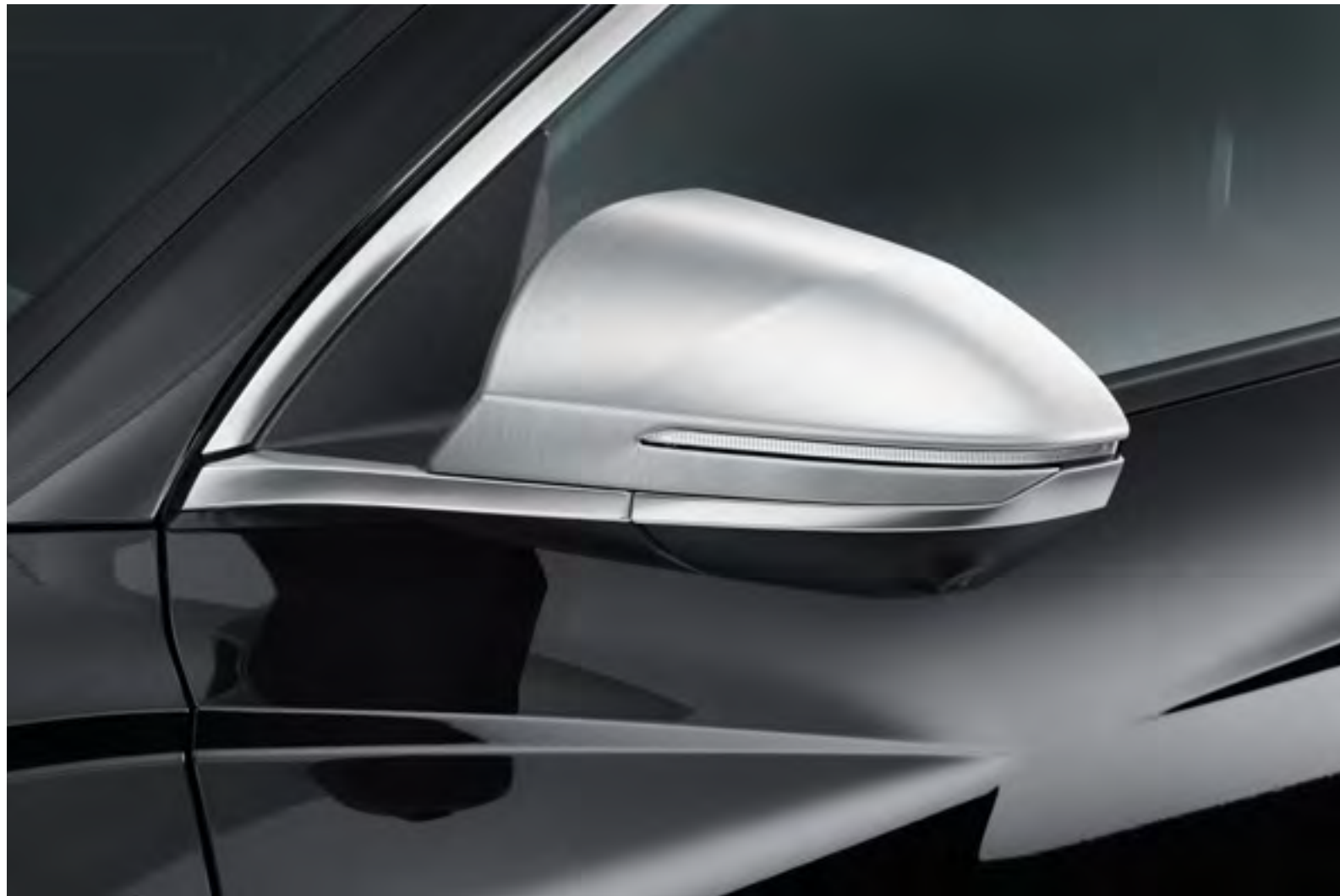
Set de cubiertas para espejos retrovisores, N7431ADE00BR