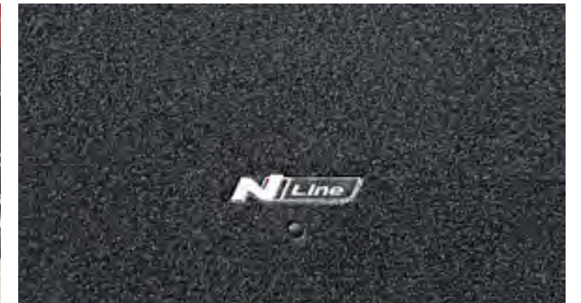
Alfombra para el maletero, logotipo N Line, N7120ADE00NL