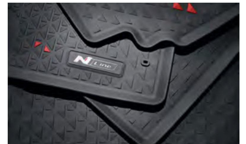
Alfombrillas de goma, N7131ADE00NL, CZ131ADE00NL, CZ131ADE00PHNL