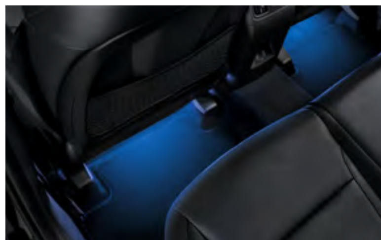
Set iluminación interior led, azul, plazas traseras, 99650ADE31