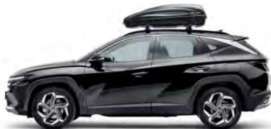
Baúl portaequipajes 330, 144 x 86 x 37.5 cm, 99730ADE10

Disfrutarás de más momentos de acción y el mínimo esfuerzo de carga. Te ofrecemos una amplia gama de sistemas de transporte fáciles y eficaces.