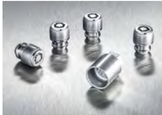
Tuercas antirrobo, 99490ADE51

Nada puede superar el efecto que tienen unas buenas llantas de aleación en la estética de un coche. Y estas llantas han sido diseñadas y fabricadas siguiendo los estrictos estándares de Hyundai.