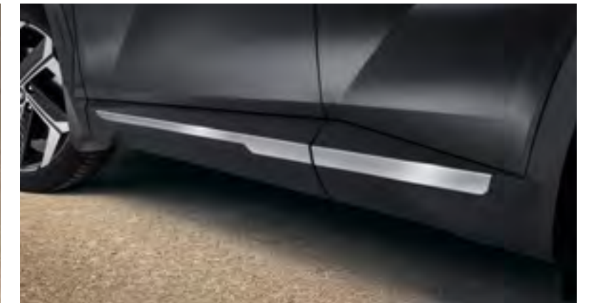
Set molduras embellecedoras laterales, N7271ADE00BR