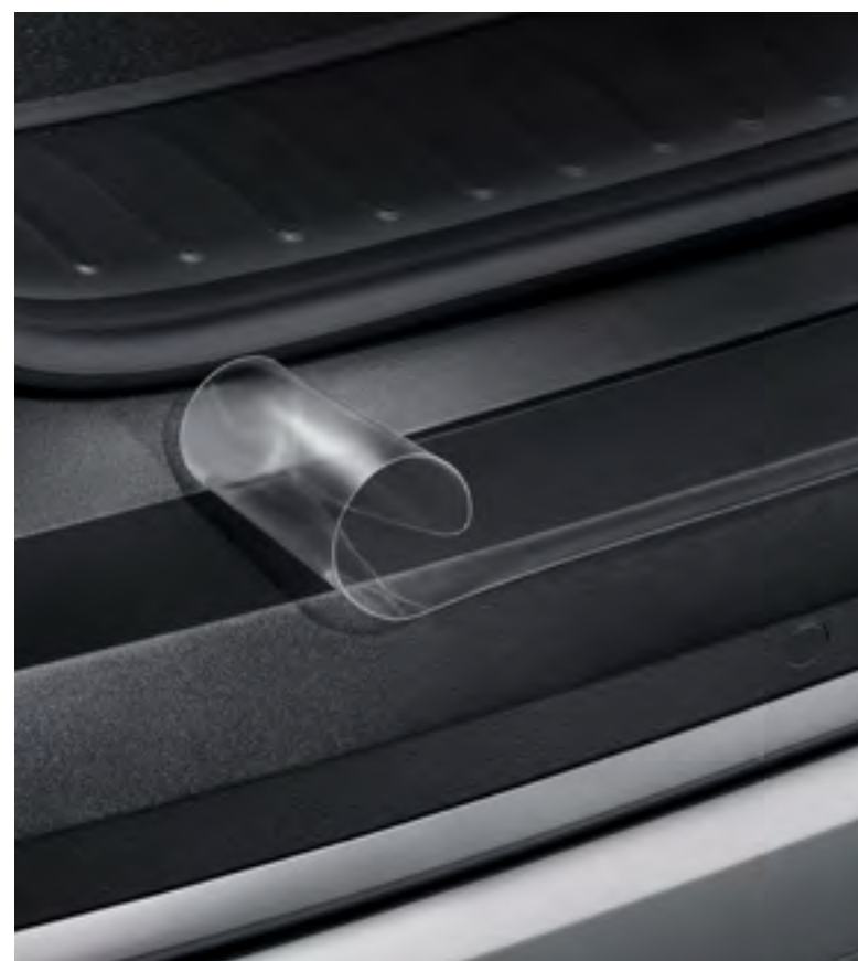
Lámina adhesiva de protección para el paragolpes trasero, transparente

Esta eficiente y discreta lámina adhesiva protege el paragolpes trasero de posibles daños mientras cargas y descargas cualquier objeto.