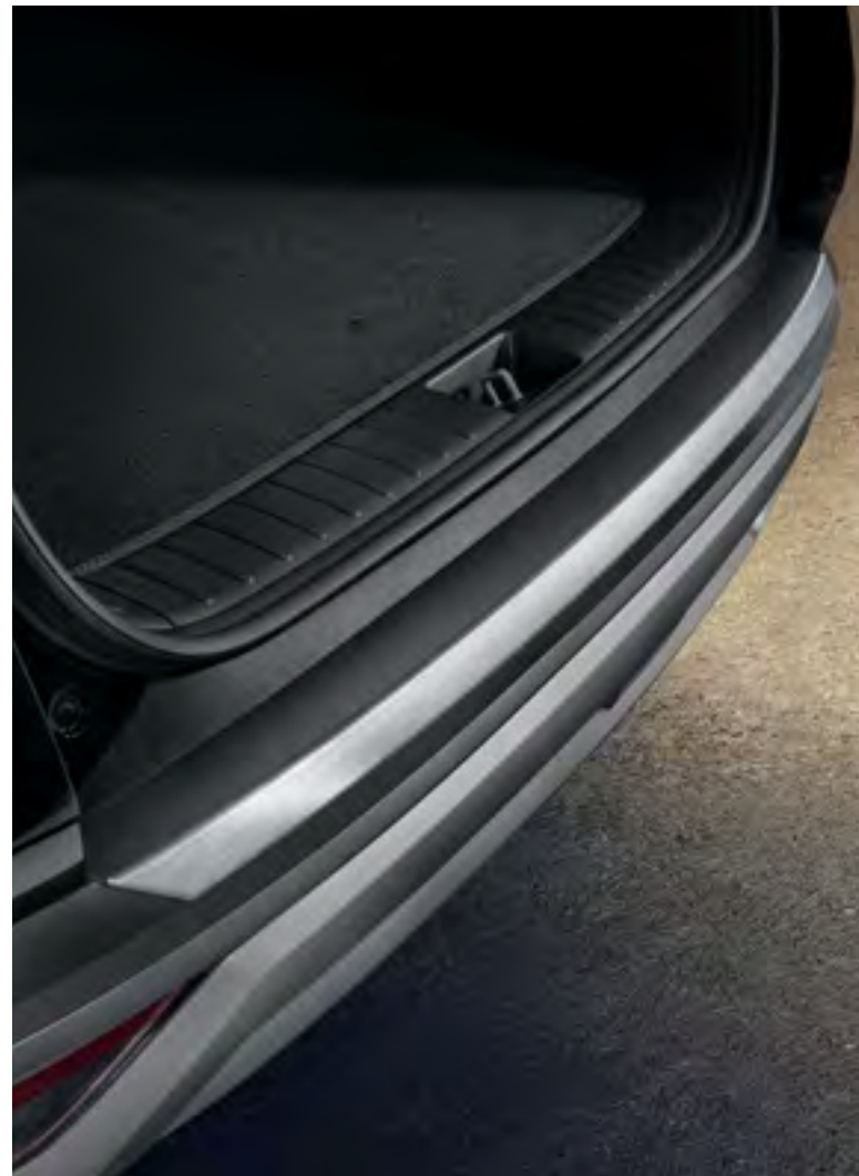
Moldura embellecedora paragolpes trasero, N7274ADE00BR