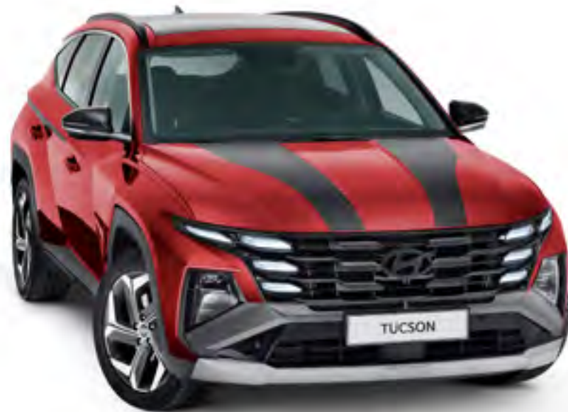
Set adhesivos Racing, negro mate N7200ADE00BL