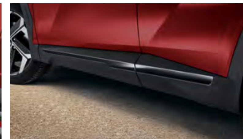
Set molduras embellecedoras laterales, N7271ADE00BL