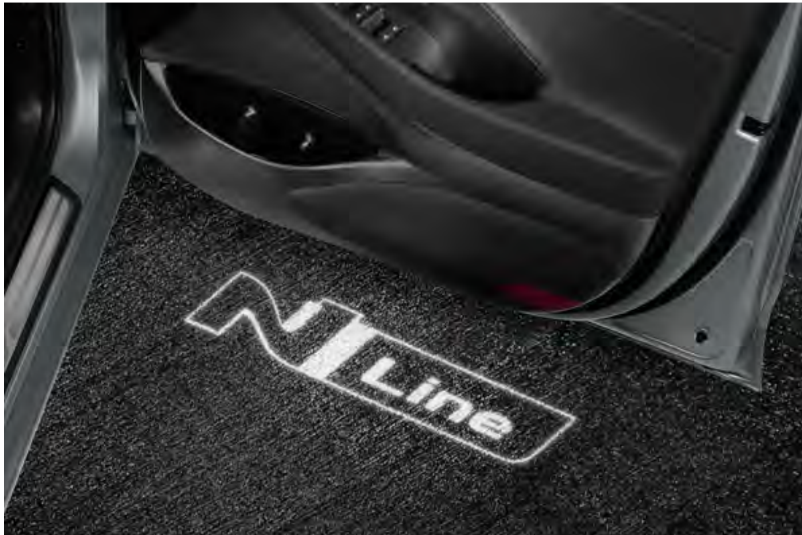
Set iluminación inferior puerta, logotipo N Line, 99651ADE00NL