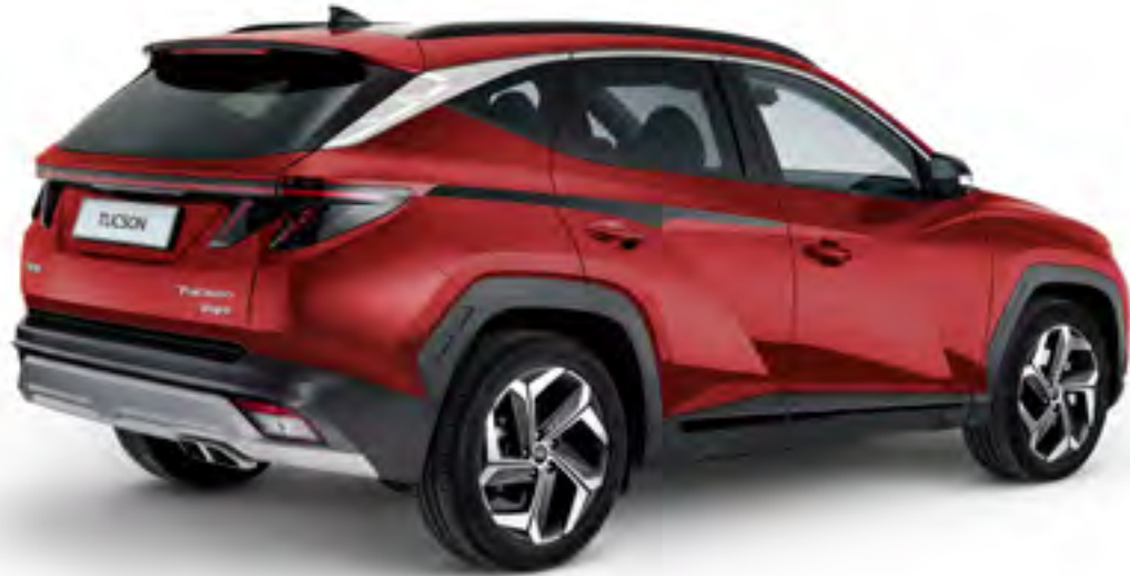
Set adhesivos Sport, negro mate N7200ADE10BL