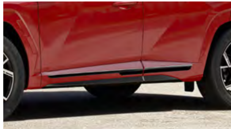
Molduras embellecedoras laterales, N Line, color negro, N7271ADE00BLNL