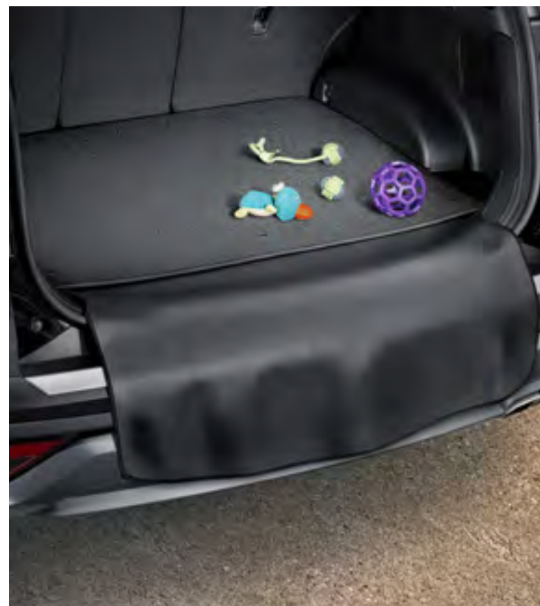
Protector textil plegable para la alfombrilla de maletero, 55120ADE00