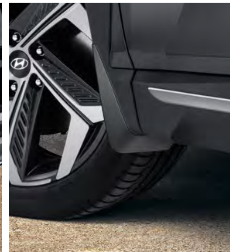
Set de guardabarros delanteros, CWF46ACA00E