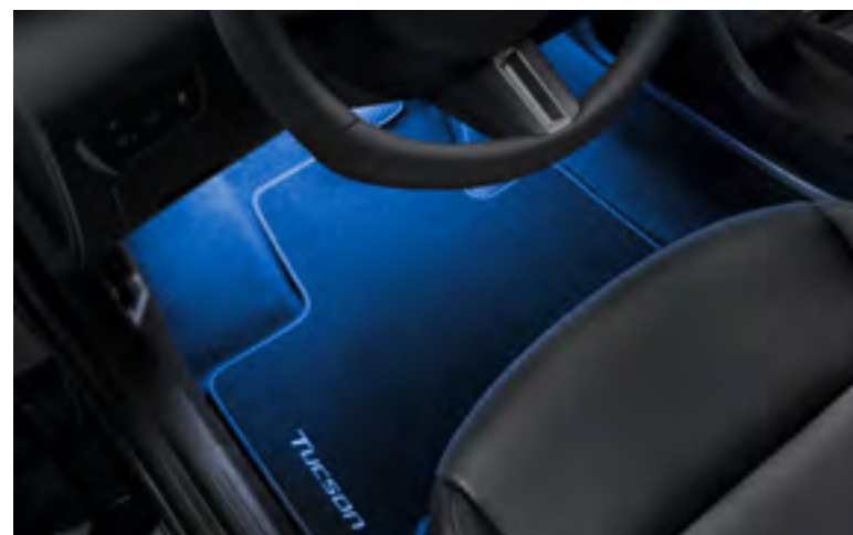
Set iluminación interior led, azul, plazas delanteras, 99650ADE20