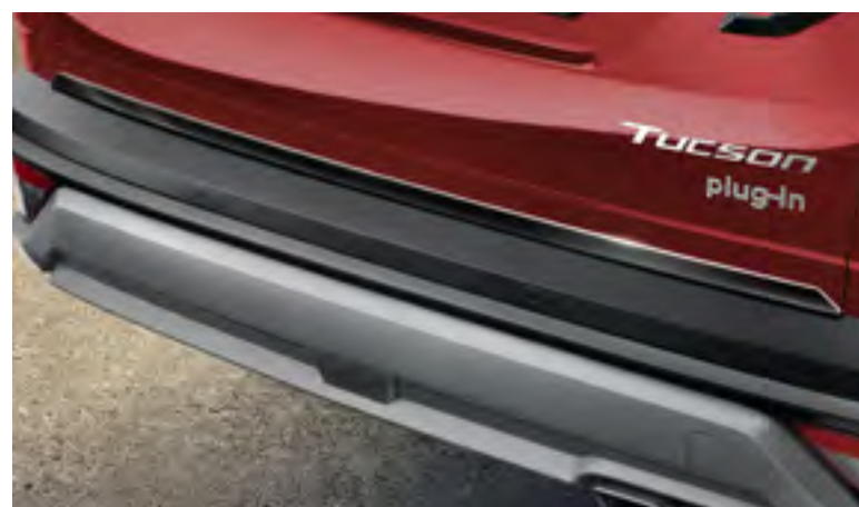
Moldura portón trasero, N7491ADE00BL